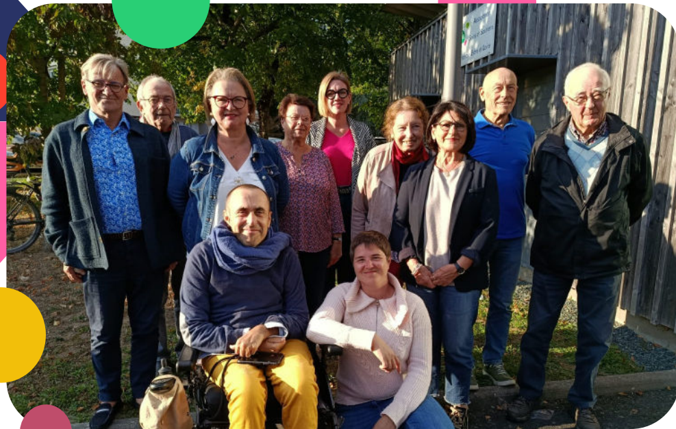
Les membres bénévoles du conseil d'administration